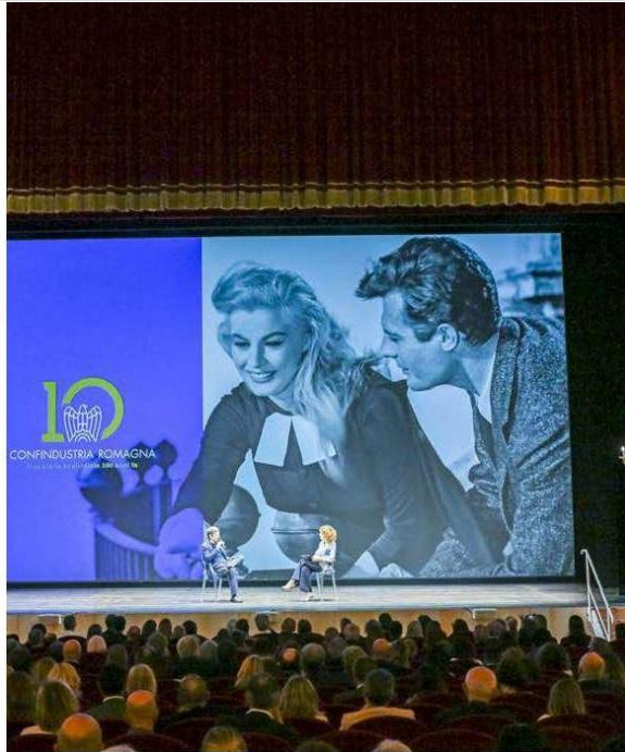
In alto Fabio de Luigi riceve il Premio Speciale alla carriera, qui sopra foto di gruppo per i premiati

mente influenzato il mio lavoro. Non esisterebbe nessun film che ho fatto senza il cinema di Fellini». Qualche imbarazzo al sentirsi chiamare "maestro", Sorrentino ha riposto di nuovo con dosi di ironia per stemperare la cerimoniosità di domande e contesto: «L'aggettivo felliniano viene usato in termini positivi, sorrentiniano invece viene spesso utilizzato in termini spregiativi» si è schermito. Quindi, tra il racconto su come nascono i suoi film e personaggi e qualche curiosità sui più recenti E' stata la mano di Dio e La grazia , c'è stato spazio anche per una precisazione sulla battuta fatta nei giorni scorsi davanti al Presidente della Repubblica Sergio Mattarella. «Se il