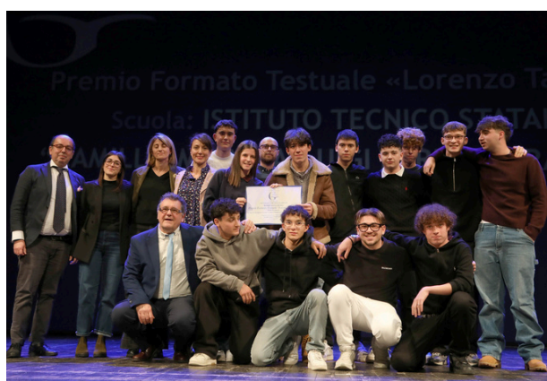
4 °A Agraria dell'Istituto tecnico Morigia-Perdisa di Ravenna