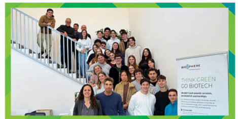
BIO SPHERE Your biotech partner Biosphere Srl ITIS "G. Marconi" Forlì