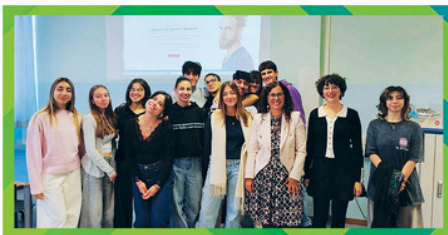
Autentika events and models Autentika Hostess & Models SAS di Vivencio D.&C. ISSS "T. Guerra" Novafeltria