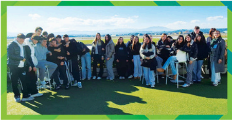
Ariminum RIMINI AIRPORT Ariminum 2014 Spa ITIS "R. Valturio" Rimini