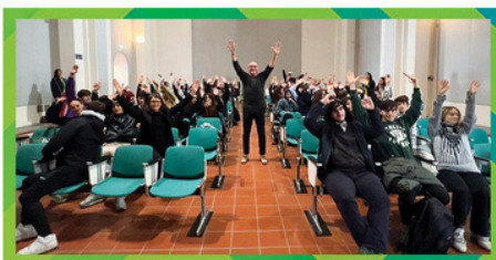
casa walden Cultura della Comunicazione Casa Walden CWC Srl IP "Ruffilli" Forlì