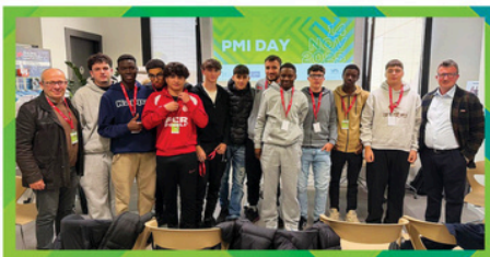
CASADEI & PELLIZZARO CLIMA & TECNOLOGIA Casadei & Pellizzaro Srl ITIS "G. Marconi" Forlì