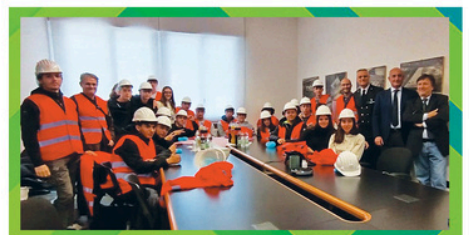
docks cereali s.r.l. Docks Cereali Spa ITIS "N. Baldini" Ravenna