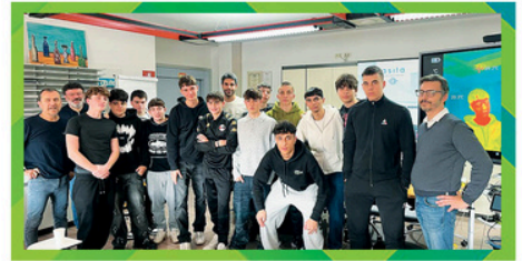
asita TECNOLOGIE DI MISURA Asita Srl ITIP "L. Bucci" Faenza