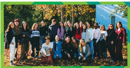
CAMPOMAGGI Gabs CATERINA LUCCHI GOLD Campomaggi & Caterina Lucchi Spa IT "Saffi-Alberti" Forlì