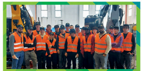
EPS Powerful Synergies C.P.S. Group Spa ITIP "L. Bucci" Faenza