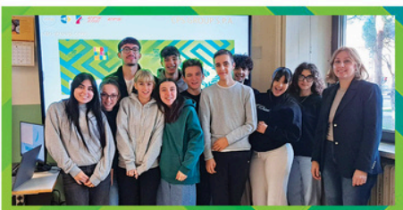
EPS Powerful Synergies C.P.S. Group Spa ITIS "A. Oriani" Faenza