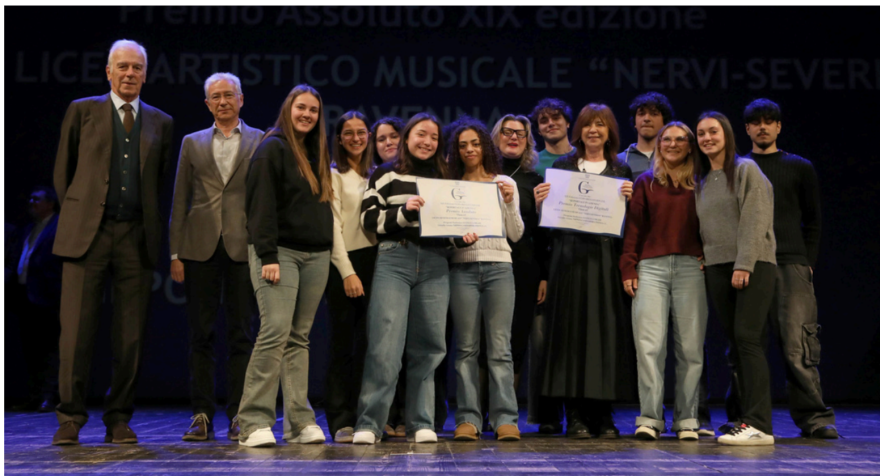
La classe 4F del Liceo Artistico Musicale 'Nervi Severini' di Ravenna

Il Liceo artistico musicale "Nervi Severini" di Ravenna vince l'edizione 2025 del Guidarello Giovani aggiudicandosi il premio per il reportage in formato digitale .