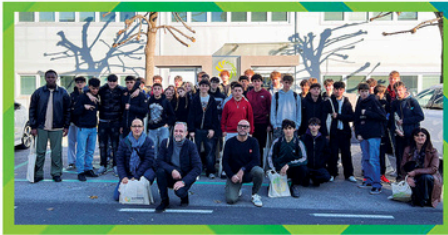
ANTARIDI Antaridi Srl ITIS "G. Marconi" Forlì