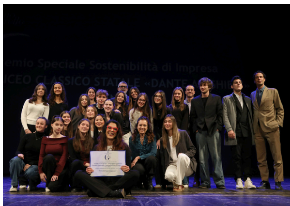
4 °B LES del Liceo Alighieri di Ravenna