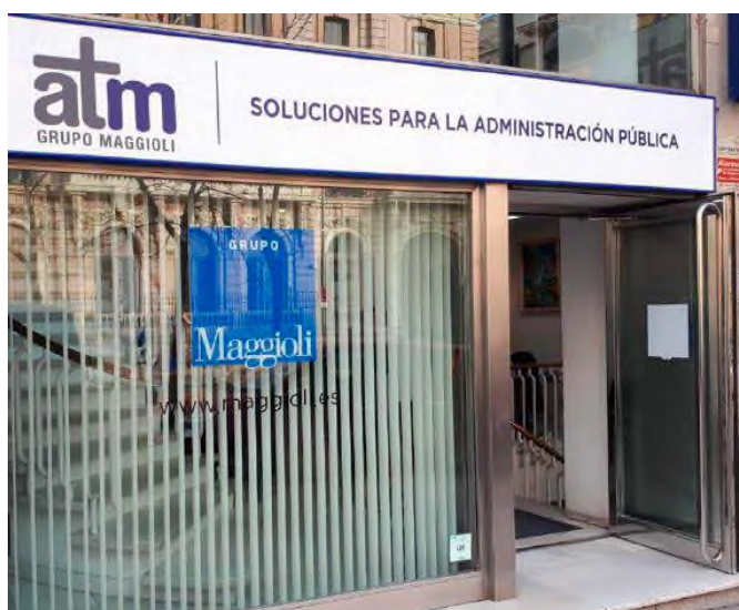
L'ingresso della sede spagnola

ne ci hanno reso forti nel tempo. Un lavoro quotidiano con un team, oggi, di quasi 2.200 persone, con circa 70 filiali in tutto il territorio italiano, una in Belgio e in Grecia, Atm Gruppo Maggioli in Spagna con 10 filiali e Maggioli Latam in Colombia con una filiale a Bogotá. In qua-