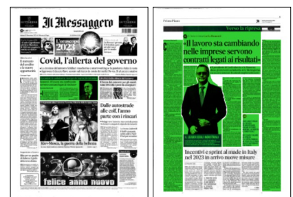
Superficie 88 %

«Non possiamo pensare di essere invincibili. E non continueremo a ottenere performance superiori a quelle dei nostri partner francesi e tedeschi, come avvenuto nel 2022, se nonosterremo gli investimenti. Nel post 2011 a ogni crisi l'industria ha trainato la ripresa dell'economia, nel 2015-2017, dopo i 9 punti di Pil