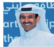
SAAD SHERIDA AL-KAABI MINISTRO DELL'ENERGIA QATAR

L'accordo è una pietra miliare perfettamente in linea con la strategia di decarbonizzazione