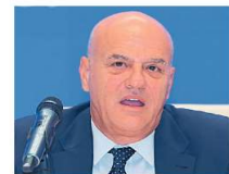
CLAUDIO DESCALZI AMMINISTRATORE DELEGATO ENI

na. Intanto, anche ieri, Gazprom ha fornito all'Italia volumi di gas in linea con i tagli dei giorni scorsi. Venerdì la Russia aveva erogato solo il 50% di quanto richiesto dall'Eni, il giorno precedente il 65%. La domanda della società italiana varia quotidianamente e fino a mercoledì scorso Gazprom aveva sempre soddisfatto le esigenze, mentre da quattro giorni la quota inviata sembra essere rimasta stabile, ma inferiore alle attese. Tanto che Eni si riserva di diffondere eventuali aggiornamenti solo «nel caso in cui vi fossero variazioni significative nelle quantità in consegna comunicate da Gazprom». Domani pomeriggio al ministero della Transizione ecologica è fissata la riunione del Comitato tecnico di emer-