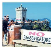
Le manifestazioni a Piombino

commissario per la realizzazione dell'opera, durante l'incontro con i sindaci della zona: «C'è un interesse nazionale da perseguire - ha spiegato - entro 120 giorni vanno raccolte tutte le autorizzazioni necessarie». Per il disturbo, Cingolani ha parlato di «adeguate compensazioni», mentre Giani ha garantito l'impegno a ottenere da Roma «gli investimenti, da anni promessi e mai fatti, che riguardano la bonifica ambientale dell'area delle accia-