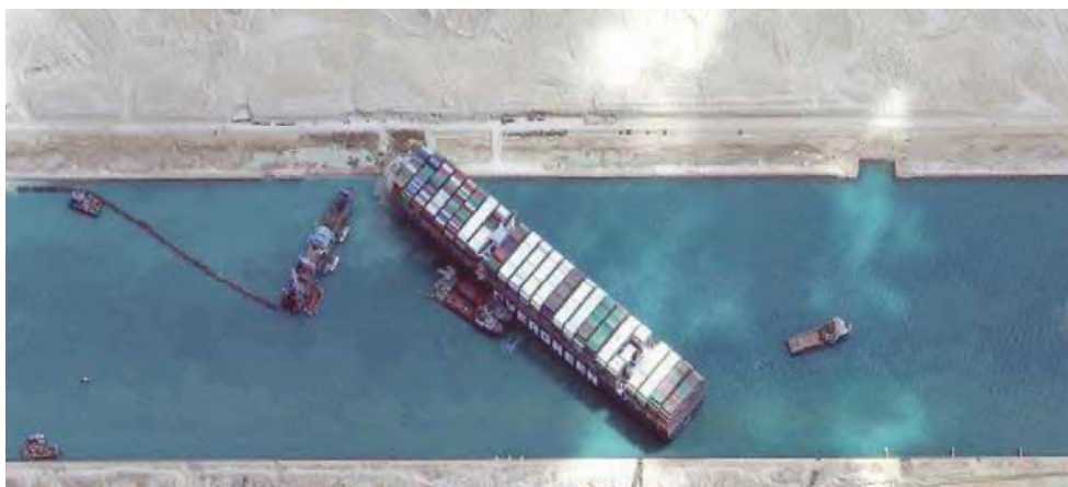
L'imbarcazione che sta bloccando il canale di Suez. Sotto, il rimorchiatore della Rosetti

Questo rimorchiatore d'altura rappresenta un concentrato di potenza e tecnologia realizzato nel cantiere Rosetti di Marina di Ravenna. Per misurarne la potenza di tiro, il team ravennate fu costretto a spostarsi a Zara, in Croazia, a causa della mancanza lungo la nostra costa di una struttura di sufficiente resi-