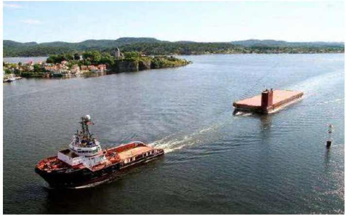
Il rimorchiatore Carlo Magno traina la barge Amt Carrier

sa ravennate aveva acquistato proprio dalla Augustea Maritime Transportation Ltd, specializzata nei trasporti marittimi internazionali di grandi manufatti con convogli propri, il pontone semi-sommersibile "Amt Carrier", costruito nel 2009. La barge, di stazza lorda di 4.500 tonnellate, si era resa necessaria alla Rosetti Marino SpA per traslare a terra — nei capannoni o nei piazzali del proprio Cantiere San Vitale di Ravenna — le unità navali destinate a lavori di trasformazione o di re-fitting particolarmente lunghi e complessi. Questo enorme manufatto era stato trasportato proprio dal Carlo Martello, che era così tornato nelle acque in cui a-