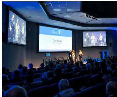
Il Premio Nobel Joseph Stiglitz e un appuntamento del Forum "Fattore R"