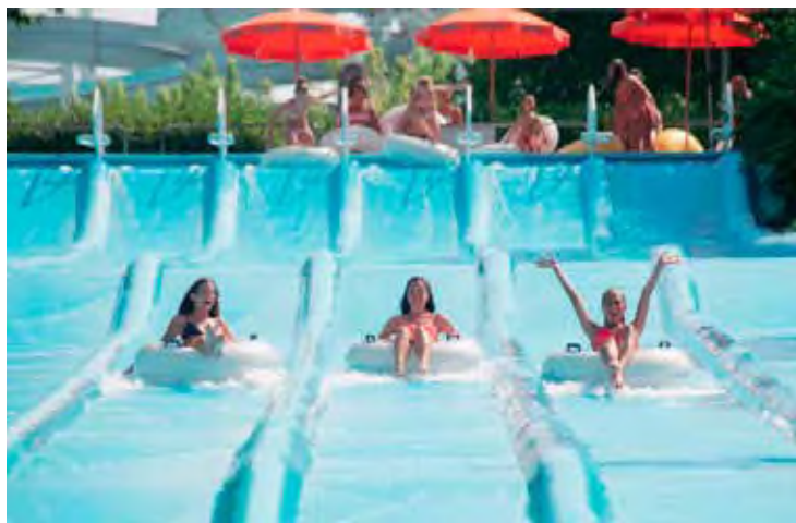
Da sinistra: alcuni scivoli di Aquafan e un delfino a Oltremare

<<Dal 13 giugno torna la Laguna dei delfini, a fine mese o a inizio luglio il parco acquatico Uno scalino colorato ogni tre per mantenere le distanze durante le file agli scivoli>>