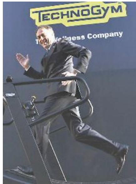
Nerio Alessandri, presidente della Technogym

Per l'ottava volta Technogym partecipa ai Giochi Olimpici come fornitore ufficiale ed esclusivo di attrezzature e tecnologie digitali per la preparazione degli atleti. La scelta è arrivata da Tokyo, dove dal 24 luglio al 9 agosto si disputeranno le Olimpiadi. Dopo Sydney 2000, Atene 2004, Torino 2006, Pechino 2008, Londra 2012, Rio 2016 e Pyeongchang 2018, l'azienda made in Cesena internazionalmente riconosciuta come marchio di riferimento nell'ambito del fitness, dello sport e della riabilitazione, aggiunge un'altra medaglia d'oro alla propria parete. Technogym allestirà 30 centri di preparazione atletica, tra cui il Villaggio Olimpico e Paralimpico. Altri centri saranno situati all'interno degli impianti dedicati alle competizioni, a disposizione di tutti gli atleti e dotati di un'ampia gamma di attrezzature in grado di coprire le necessità di preparazione atletica per ogni disciplina sportiva. Nel complesso l'azienda fornirà circa 1,200 attrezzi, a disposizione dei circa 15mila atleti tra olimpici e paralimpici,