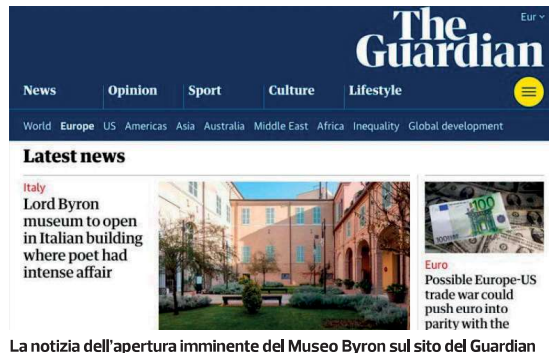
La notizia dell'apertura imminente del Museo Byron sul sito del Guardian

L'articolo del quotidiano londinese fa anche seguito al grande rilievo che hanno dato all'evento tutti gli inviati delle principali testate nazionali, presenti sabato mattina alla conferenza stampa di presentazione del museo.