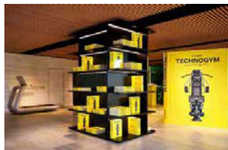
Due immagini della mostra allestita nello spazio Technogym di Milano