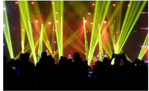
Tutto pronto in Fiera a Rimini per la settima edizione di Mir

in un epicentro per i sistemi audiovisivi integrati, ampliando il proprio focus verso soluzioni all'avanguardia adatte anche agli spazi lavorativi ed educativi. Grazie alla partnership con la Systems Integration Experience Community (Siec), diventa un