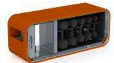
La creazione di Antonio Citterio