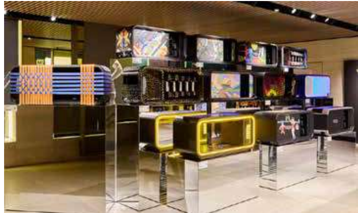
La mostra a Milano resterà aperta fino al 21 aprile