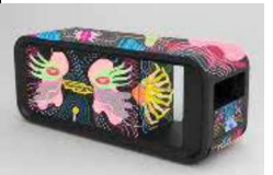
L'opera di Elena Salmistraro