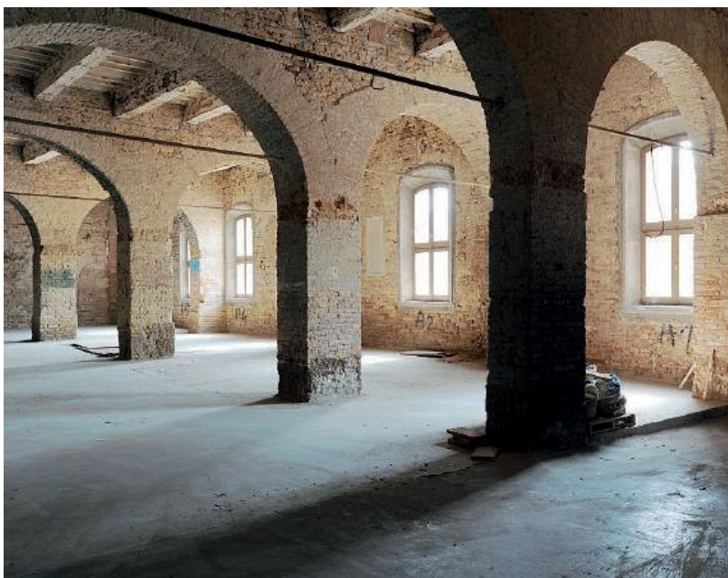
In alto Leonardo Spadoni; sotto un'immagine dell'interno del Molino