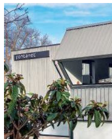
La sede dell'azienda

Fontanot. Negli anni '80 il marchio Albini & Fontanot diventa celebre in tutto il mondo per aver realizzato un processo industriale per la costruzione di scale a chiocciola e a giorno. Nel 1982 Albini & Fontanot lancia il modello Xnodo, la prima scala a chiocciola con sistema di regolazione della struttura in orizzontale e verticale. Superato il concetto di scala intesa come pezzo unico e indivisibile, l'azienda passa alla realizzazione di scale in kit facili da montare, pensate per chi desidera personalizzare in piena libertà la propria abitazione, dando vita ai marchi Arkè, Pixima e Magia. Nel 2009 l'azienda ripensa se stessa e pone ulteriori sfide, iniziando una nuova avventura cambiando il marchio da Albini & Fontanot a Fontanot.