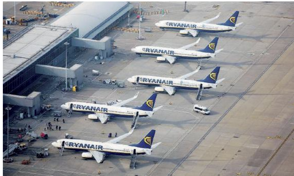
La flotta degli aerei della compagnia Ryanair all'aeroporto di Stansted

Per il Fellini un «grande giorno», sottolinea l'amministratore delegato di AirRiminum,