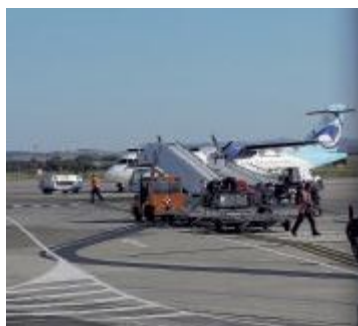
L'aeroporto di Rimini

Il turismo ricettivo italiano ha da oggi un nuovo player, che punta a portare in Italia fino a 3 milioni di turisti, e sceglie di allearsi con la società di gestione dell'aeroporto di Rimini. Il tour operator "ItaliaBella" vuole infatti valorizzare e vendere all'estero il "prodotto Italia" in modo moderno, organizzato e in-